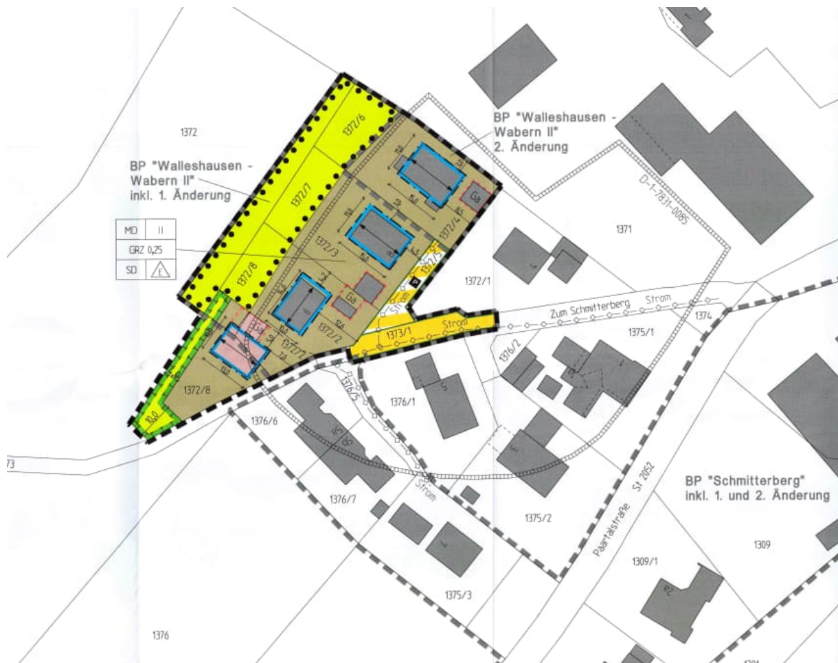
Karte: Bebauungsplan „Walleshausen – Wabern II“ im OT Wabern (Quelle: 3. Änderung Bebauungsplan „Walleshausen – Wabern II“ vom 24.07.2024)

Die folgende Karte zeigt den Bebauungsplan des Neubaugebietes „Walleshausen – Wabern II“ im OT Wabern.