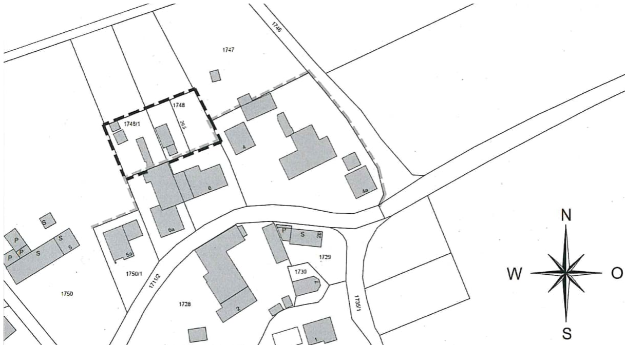
Karte: Bebauungsplan „Flur-Nrn. 1748 und 1748/1“ im OT Petzenhofen (Quelle: Bekanntmachung des Satzungsbeschlusses zur Einbeziehung vom 08.11.2023)

Die folgende Karte zeigt den Bebauungsplan des Neubaugebietes „OT Petzenhofen, Flur-Nrn. 1748 und 1748/1“ im OT Petzenhofen.