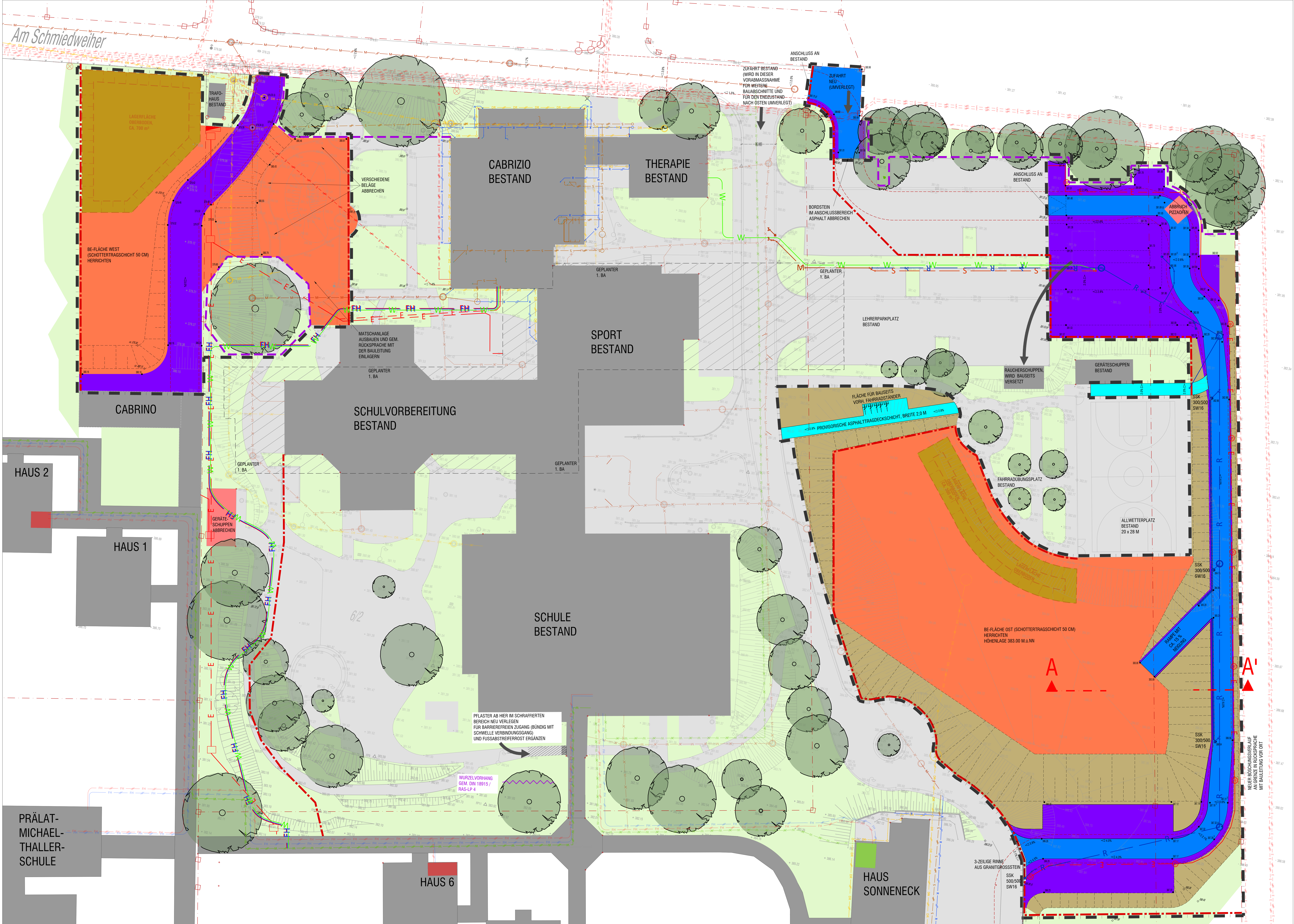
GRUNDRISS GESAMTMASSNAHME, M 1:200