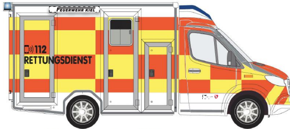
Abbildung 1 Folierungslayout RTW-SH

Flächige Battenburg Markierung Tagesleucht rotorange (3M 3484 oder gleichwertig) / Saturngelb fluoreszierend (3M 3485 oder gleichwertig)